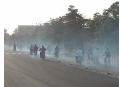
Circulation dans une rue de Ouagadougou, Burkina Faso (J-C Bolay)

La DDC participe aussi au dialogue politique international à travers les principaux réseaux urbains multilatéraux et bilatéraux, parmi lesquels ceux du Urban Management Programme/UMP (PNUD, UN-HABITAT, Banque mondiale, et bilatéraux) et du Groupe d'experts urbains de la Commission de l'Union européenne. La Politique de Développement urbain de la DDC, définie dans une conception innovatrice transsectorielle de l'urbain, donne un cadre très large pour une approche systémique avec deux champs d'action centraux : villes intermédiaires et interdépendance urbaine-rurale. Les villes intermédiaires jouent un rôle de relais régional entre les grandes agglomérations urbaines et les petites villes à rayonnement local et zones rurales. Elles représentent aussi des lieux privilégiés pour l'émergence d'une gouvernance participative et d'une citoyenneté démocratique, tels que l'illustrent les programmes urbains DDC de Yogyakarta en Indonésie Nam Dinh et Dong Hoi au Vietnam, ainsi que celui des villes moyennes au Burkina Faso. L'interdépendance urbaine-rurale constitue un champ concret pour mettre en oeuvre des stratégies qui agissent sur la complémentarité et les synergies entre potentialités urbaines et rurales.