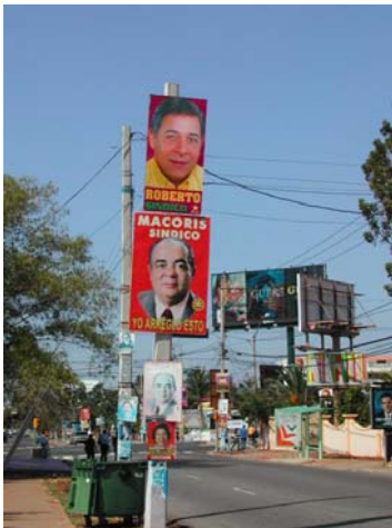
Campagne politique en République Dominicaine (J-C Bolay)

- Pour des villes durables . Une majorité de villes dans les pays du Sud, où se propagent pauvreté, dégradation environnementale, inégalités, tensions sociales et insécurité, forme un panorama de villes non durables.